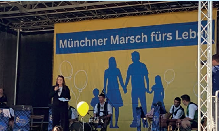
Große Bühne bei der Schlusskundgebung zum Marsch

denen diese selbstverständlich legitim ist. Die meisten Abtreibungen nach der 14. SSW werden durchgeführt, weil das Kind eine Behinderung hat. Über 3.000 Mal wurden solche sogenannten Spätabtreibungen 2022 in Deutschland vorgenommen. In 740 Fällen sogar nach der 22. SSW, also zu einem Zeitpunkt, an dem das Kind bereits außerhalb des Mutterleibes hätte überleben können. Um ein Überleben der Abtreibung auszuschließen, tötet man die Kinder in diesen Fällen