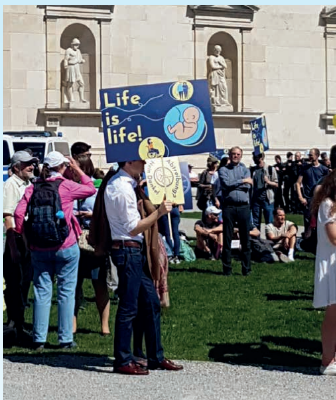
Teilnehmer beim „Marsch für das Leben“ in München

Nachts um halb zwölf im Nürnberger Hauptbahnhof, am Vorabend des Marsches fürs Leben in München. Ich stehe neben einer jungen Frau am Gleis. Wartend auf den gemeinsamen Zug, kommen wir ins Gespräch. Sie fragt mich, was ich denn in München mache. Ich antworte, dass ich zum Marsch für das Leben fahre. Ihre Reaktion nach einer kurzen Pause: „Wild!“ Eine ähnliche Reaktion erlebte ich schon am Tag zuvor bei einem Freund. Auch er fragte mich, was ich in München vorhätte. Auf meine Antwort, dass ich zum Marsch fürs Leben fahren würde, sagte