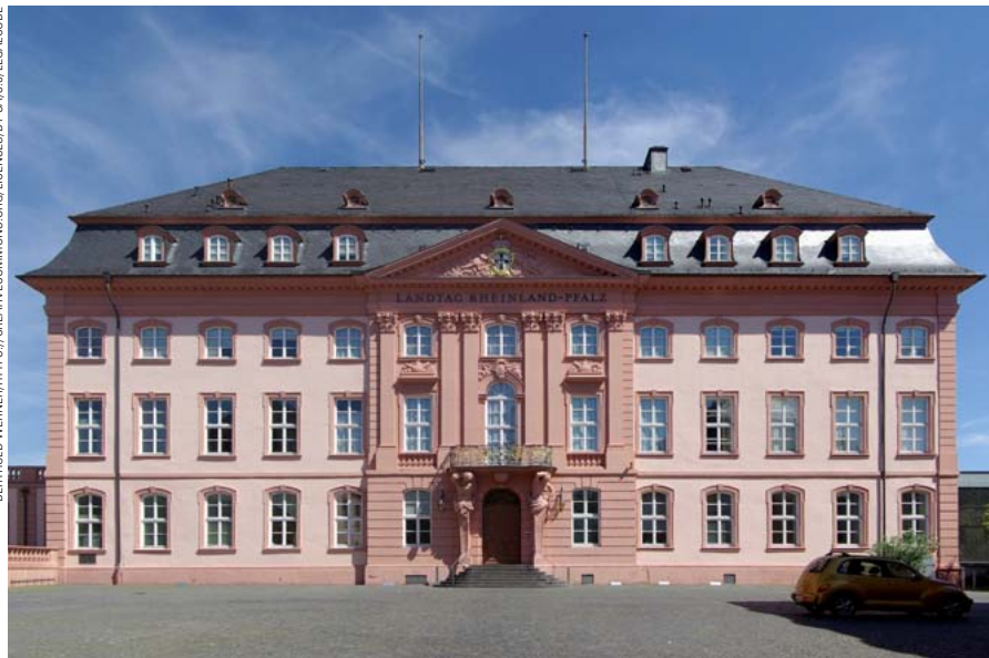
Gebäude des Landtags in Rheinland-Pfalz

Wir kennen den Sachverhalt und die Fördergrundlage in diesem konkreten Fall nicht ausreichend. Klar ist, dass wir Menschen, die sich in einer existenziellen Notlage befinden, Hilfe und Beratung anbieten müssen – und das so wohnortnah wie möglich. Ein Schwangerschaftsabbruch ist eine Ausnahmesituation für die schwangeren Frauen. Die anerkannten Beratungsstellen leis-