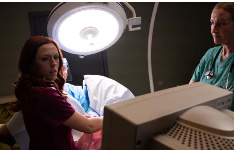
Szene aus »Unplanned«: Abby assistiert bei einer Abtreibung

Der Anfang von „Unplanned“ beginnt mit einer Abtreibung, die auf Ultraschall mit einer exakten Auflösung zu erkennen ist. Man sieht: Das Rückgrat des Babys ist schon klar ausgebildet. Auch den Herzschlag des ungeborenen Kindes hört man deutlich.