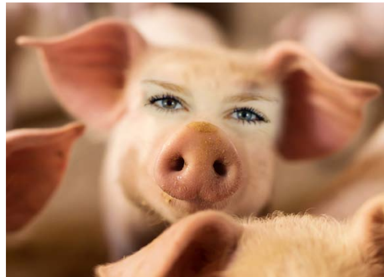
Beunruhigend: Mischwesen als Gewebespende (Bildmontage)

Bereits im Oktober 2011 fragte der Deutschen Ethikrat, „ob schon die Konstruktion eines menschlichen Mischwesens ... [nicht] eine vollständige Instrumentalisierung“ des Menschen