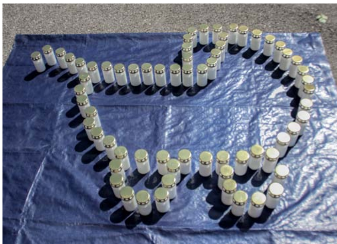
100 Kerzen für 100 Kinder, die Stapf jede Woche abtreibt

Wer soll der CSU noch glauben, daß sie sich hinter den Schutz des Lebens auch der ungeborenen Menschen stellt, wenn ein prominentes Parteimitglied sein Geld mit der Vermietung an einen Abtreiber verdient, den CSU-Politiker früher schon als „Fließbandabtreiber“ bezeichnet haben?“