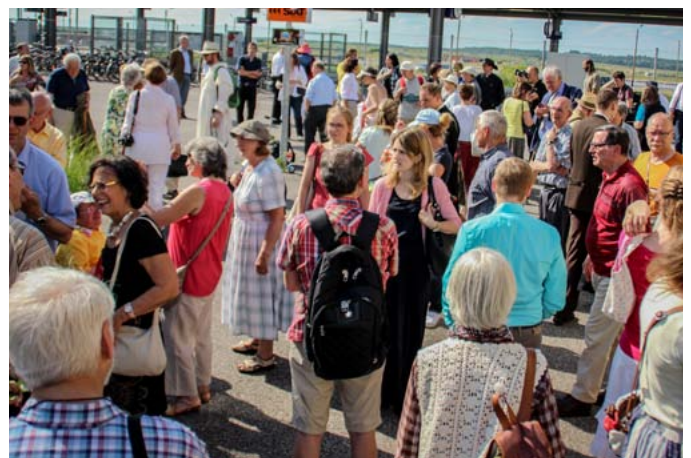
Zahlreiche Teilnehmer folgten dem Aufruf zur Mahnwache