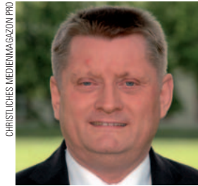
Herrmann Gröhe, CDU

Hinweis: Die DGPPN-Stellungnahme ist im Web zu finden unter www.dgppn.de/presse/pressemitteilungen/detailansicht/article/forschung-in.html