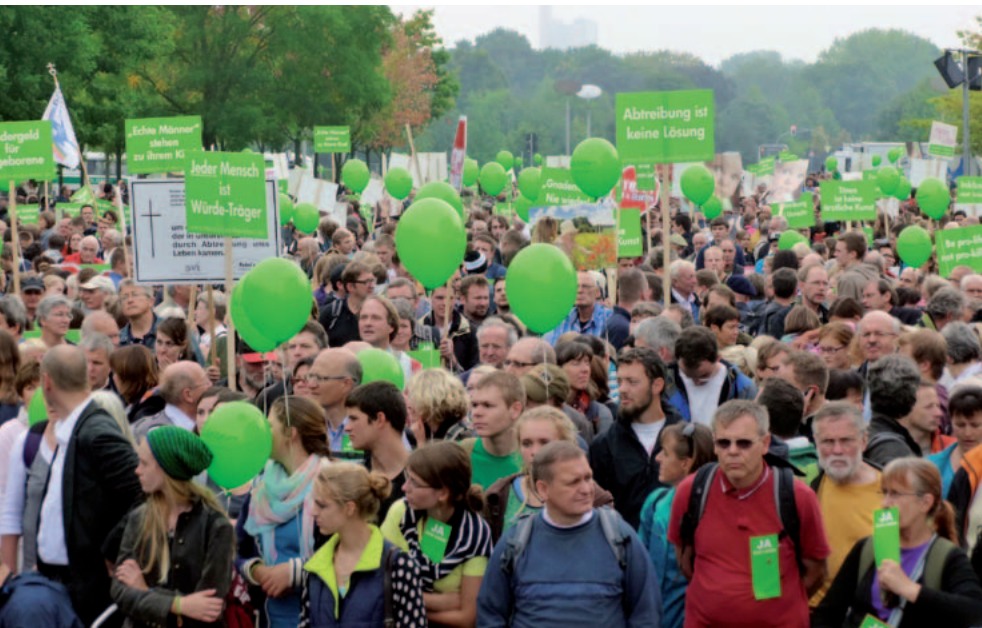
Aufbruch in Berlin: mehr als 5.000 Teilnehmer beim „Marsch für das Leben“ 2014

Eindrucksvoll auch Ort und Weg: vor dem Bundeskanzleramt, am Reichstag und Holocaustmahnmal vorbei ging der Zug. Mitten durch das neue, wenig christlich geprägte Macht- und Konsumzentrum der Republik. Jedes Leben gleichermaßen anzunehmen, Respekt und Achtung davor neu einzufordern, Politik und Gesellschaft wieder wachzurütteln, vor Sterbehilfe und Abtreibung zu warnen, das waren Ziele und Hauptmotive aller Redner und Teilnehmer. Ihr Protest richtet sich gegen erbarmungslos und menschenfeindlich praktizierte Selektion, Abtreibung und Mitwirkung am Suizid.