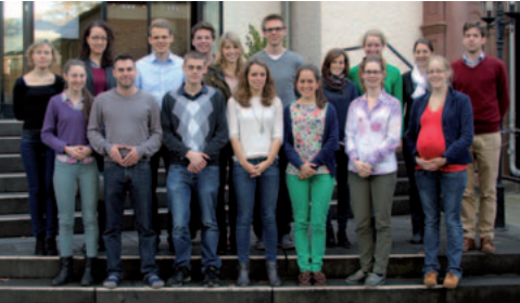
Teilnehmer der Jugendakademie

Zum sechsten Mal fand die Akademie Bioethik vom 30. Oktober bis 1. November 2014 auf Schloss Eichholz in Wesseling statt. In Zusammenarbeit mit der Konrad-Adenauer-Stiftung informierten sich die 23 jungen Mitglieder der CDL und der Jugend für das