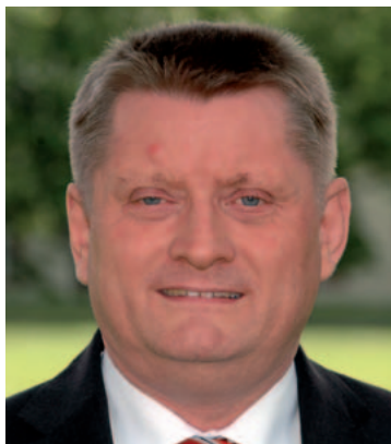
Hermann Gröhe, CDU

In der Tageszeitung „Die Welt“ (Berlin) warnt Hermann Gröhe (CDU) davor, die Freiheit zur Selbsttötung zu verklären: „Manche junge Menschen genießen das Motorradfahren und sind der Überzeugung, daß sie lieber gar nicht leben würden als im Rollstuhl. Das ist eine Haltung, die sich nicht ausbreiten darf. Ich möchte, daß Menschen, die sich durch eine Behinderung, nach einem Unfall oder im Alter, nicht mehr allein versorgen können, wissen: die Gesellschaft hilft mir. Kein Mensch darf sich mit dem Gefühl beschäftigen müssen: Ich falle anderen zur Last, deshalb mache ich lieber Schluß.“ So setzt sich Minister Gröhe auch für ein Verbot der Suizidbeihilfe ein und bekommt Gegenwind aus humanistischen Kreisen. Ein solches Verbot widerspreche dem Selbstbestimmungsrecht, sagte u. a. die Koordinatorin des „Bündnisses für Selbstbestimmung bis zum Lebensende“, die SPD-Politikerin Ingrid Matthäus-Maier.