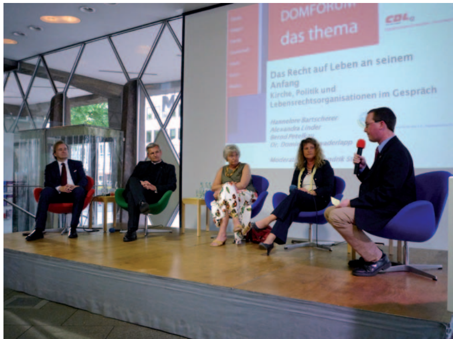
Podiumsdiskussion vor zahlreichen Zuschauern beim Domforum in Köln

komme. Er betone immer, daß es um die Würde des Menschen ginge. Grundlage ist das Grundgesetz, Artikel 1 und Artikel 2. In dem Zusammenhang ist Abtreibung bereits vom II. Vatikanischen Konzil als „Abscheuliches Verbrechen“ bezeichnet worden, weil der wehrloseste aller Menschen getötet wird. Eine sogenannte „Entscheidungsfreiheit“ gäbe es nicht mehr, wenn ein Mensch