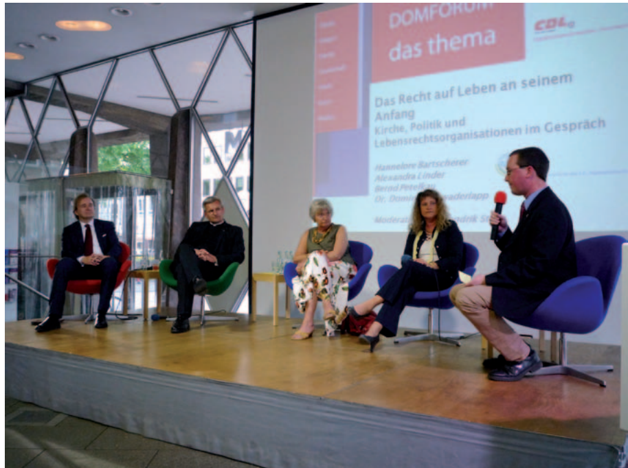
Podiumsdiskussion vor zahlreichen Zuschauern beim Domforum in Köln

komme. Er betone immer, daß es um die Würde des Menschen ginge. Grundlage ist das Grundgesetz, Artikel 1 und Artikel 2. In dem Zusammenhang ist Abtreibung bereits vom II. Vatikanischen Konzil als „Abscheuliches Verbrechen“ bezeichnet worden, weil der wehrloseste aller Menschen getötet wird. Eine sogenannte „Entscheidungsfreiheit“ gäbe es nicht mehr, wenn ein Mensch