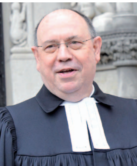
CHRISTLICHES MEDIENMAGAZIN PRO

So verwundert es nicht, daß manche Medien schnell seinen Beitrag beipflichtend aufgreifen, so doch vor allem aus einem Grund: